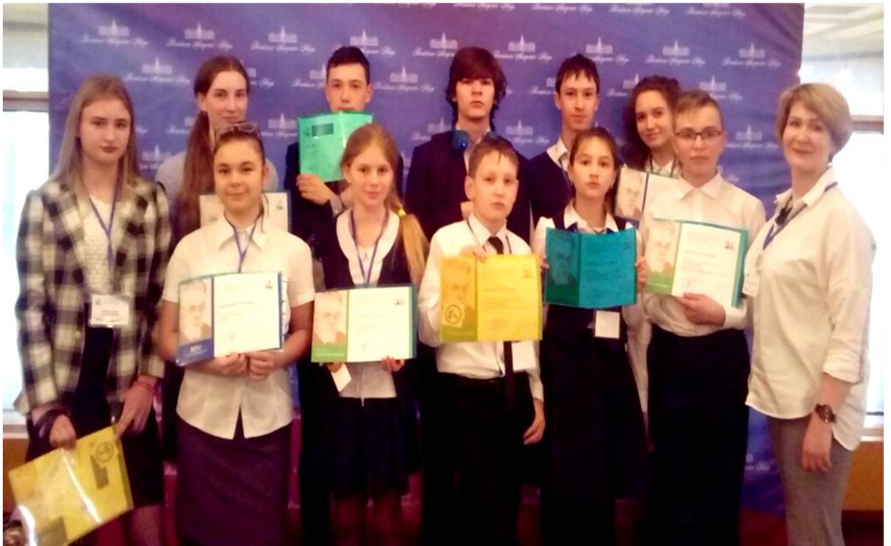
Команда Иркутской области после награждения