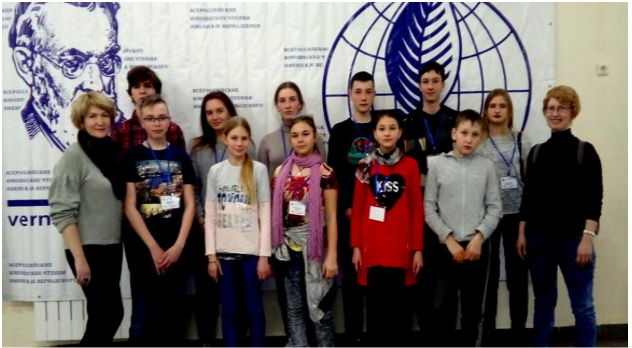
Вся команда Иркутской области перед РАН