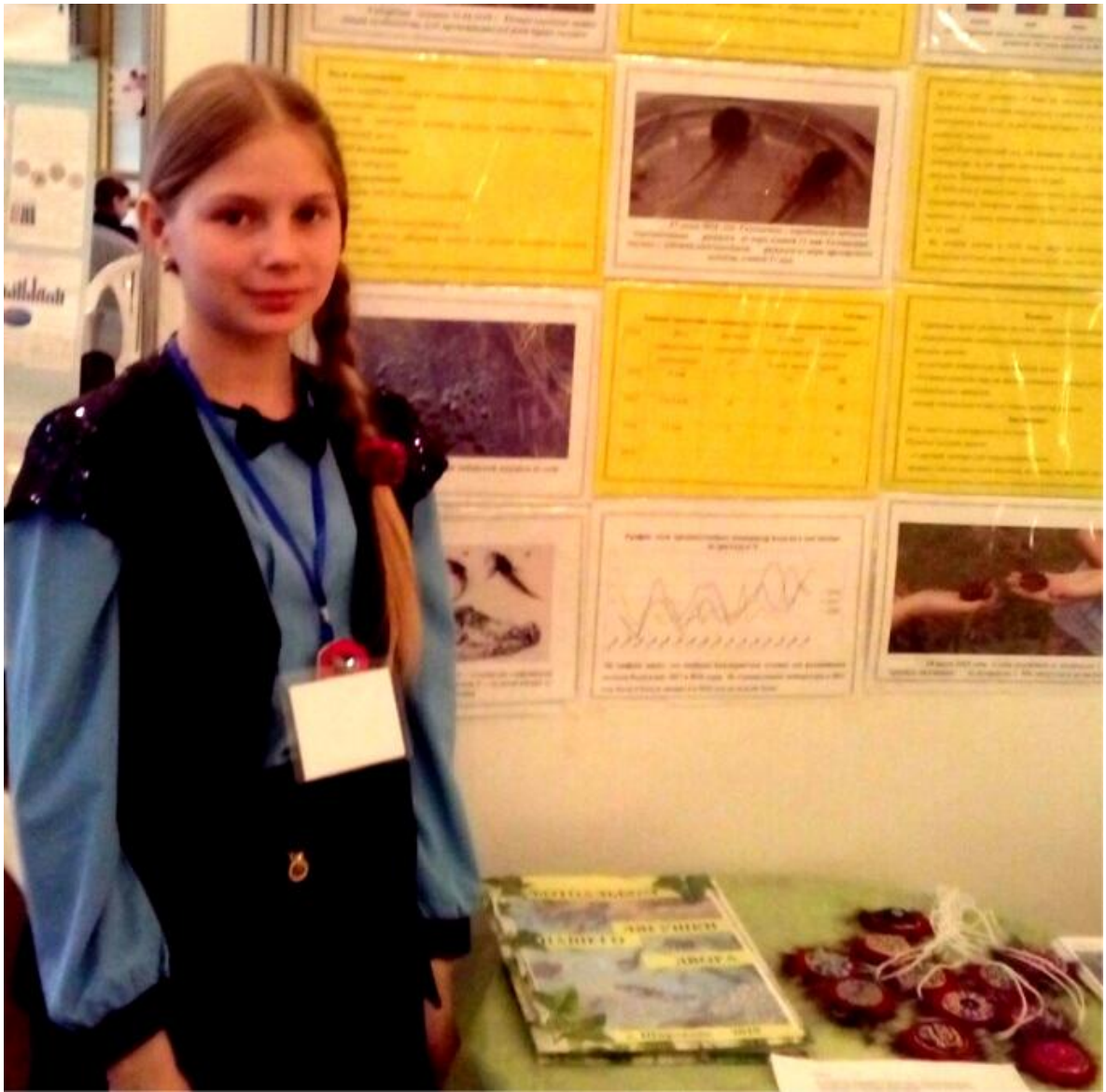
Катюша к защите готова!